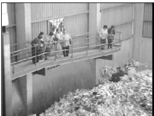
Grupo de Mujeres de un Centro de Educación de Adultos en el interior de las instalaciones. Foso de recepción de envases ligeros.