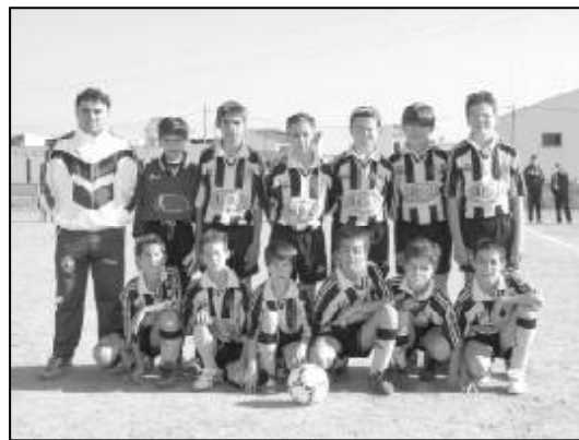
El equipo de fútbol 7 al completo.