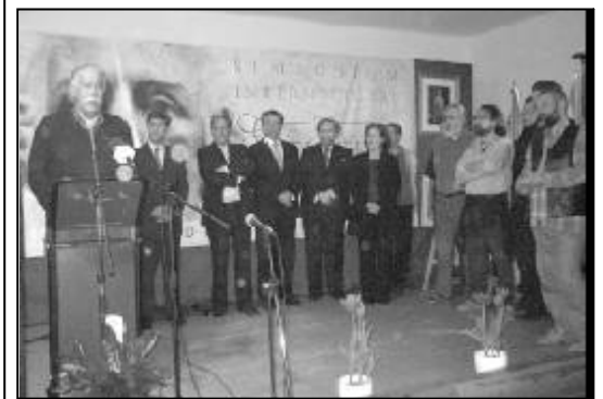
Uno de los escultores seleccionados dirigiéndose al público.