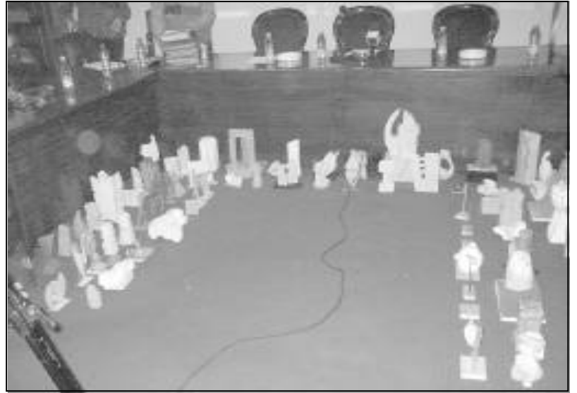
Las maquetas seleccionadas para el III Simposium de Escultura decoraron el Salón de Plenos.

En el tercer punto del orden del día se aprobó la firma de un Convenio con la Consejería de Obras Públicas y Transportes para la construcción de un apeadero de autobuses , para lo cual hay que poner los terrenos a disposición de la Consejería, considerándose adecuados los que se encuentran junto a la Oficina de Empleo, de unos 1.100 m 2 . La estación será para tres autobuses, y el presupuesto para su construcción es de