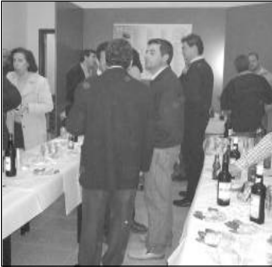
El acto de inauguración estuvo muy animado.