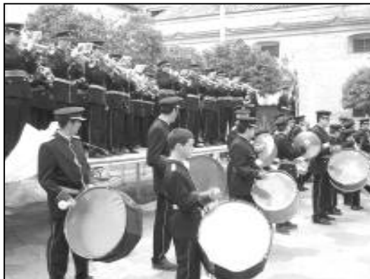
Las bandas de Posadas y Palma del Río durante su actuación conjunta.